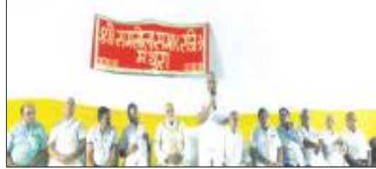
सात अक्टूबर को मुकुट पूजन, 11 अक्टूबर को राम जन्म, 14 अक्टूबर को धनुष यज्ञ, 15 अक्टूबर को श्री राम वारात, 24 अक्टूबर को विजयदशमी, 25 अक्टूबर को भरत मिलाए, 26 अक्टूबर को राजगद्दी एवं 27 अक्टूबर को शांति पाठ होगा। सात अक्टूबर से 17 अक्टूबर तक श्री राम लीला श्री कृष्ण जन्मस्थान पर होगी। 18 अक्टूबर से 23 अक्टूबर तक मसानी स्थित चित्रकूट लीला मंच पर होगी एवं 22 अक्टूबर से 24 अक्टूबर तक