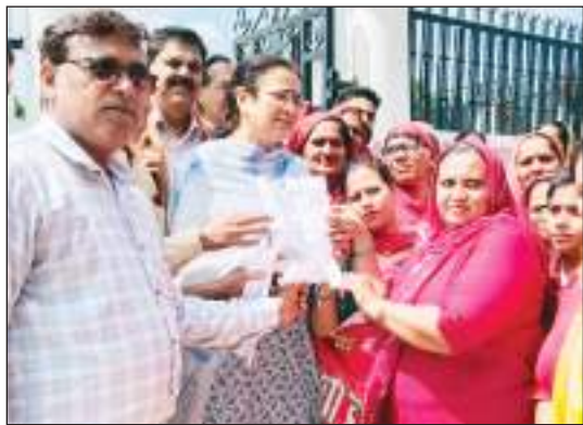
आशा वर्करों को मानदेय बहुत कम दिया जा रहा है। जिससे परिवार को गुजारा बड़ा मुश्किल से होता है।